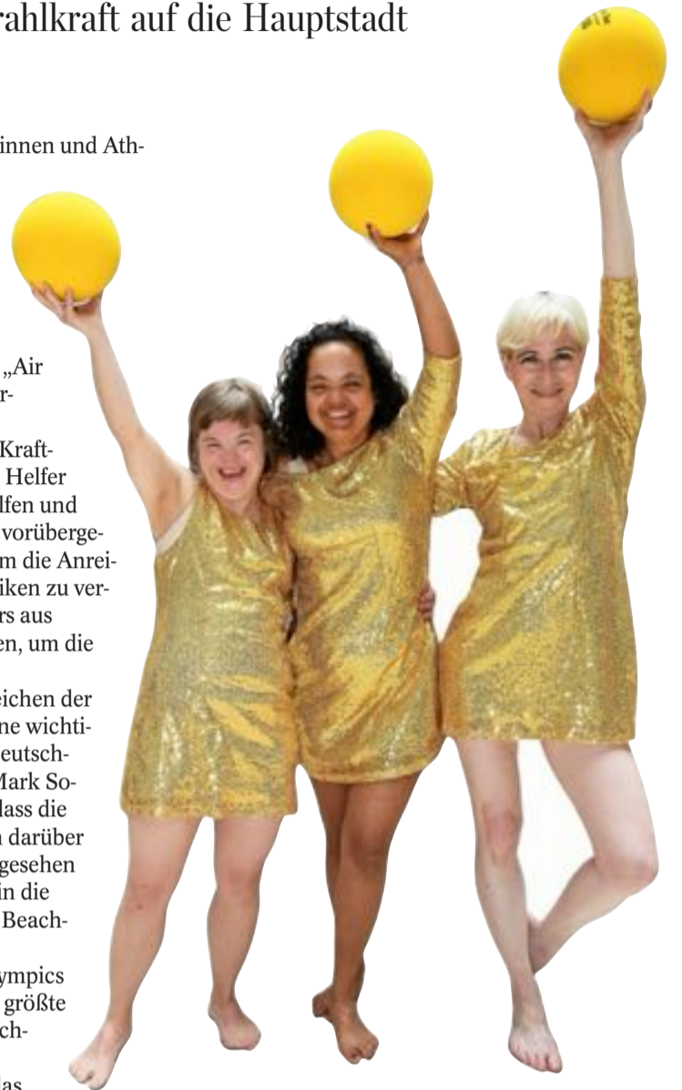
Teilnehmerinnen bei der Eröffnungszeremonie.

330.000 Menschen haben die Special Olympics World Games in Berlin besucht. Es war die größte internationale Sportveranstaltung in Deutschland seit den Olympischen Spielen 1972 in München. Mit einem Rahmenprogramm, das weit über die Wettbewerbe hinausging, trugen sie ihren Teil für mehr Inklusion bei.