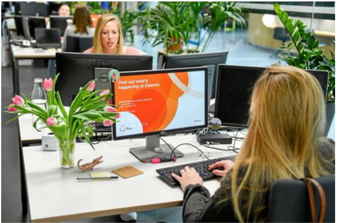
Zalando sucht weltweit nach Mitarbeitenden für ihren Unternehmensstandort in Berlin.

Die Einwanderung von ausgebildeten Menschen soll verein-