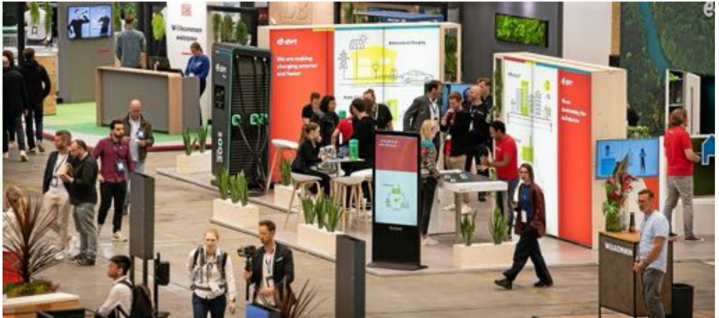
Die Welt zu Gast in Tegel: Das Greentech Festival lockte 11.500 internationale Gäste zum ehemaligen Flughafen.

Ein Höhepunkt war die Veranstaltung im „The Berlin Level“, bei