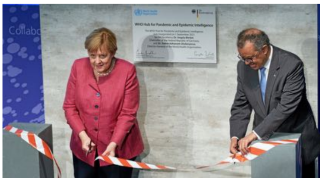
Symbolischer Start: Angela Merkel weihte das innovative „WHO Hub“ ein.

Vielleicht kann das WHO Hub in Berlin dazu beitragen, die nicht nur von Ranga Yogeshwar beklagten Datenlücken zu schließen – damit zielführender auf mögliche künftige Pandemien reagiert werden kann.