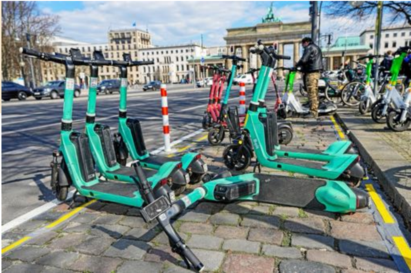
Abgestellte E-Roller verschiedener Anbieter an einer Jelbi-Station der BVG.